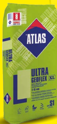
ULTRA GEOFLEX Wysokoelastyczny odkształcalny klej żelowy