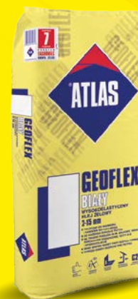
GEOFLEX BIAŁY Wysokoelastyczny klej żelowy